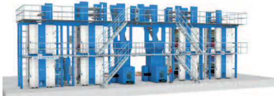
Die KBA Commander CL-Anlage für die Oppermann Druck- und Verlagsgesellschaft im niedersächsischen Rodenberg.

2015 sind die Würzburger Erfinder der Zeitungsdruckmaschine auch im Rollenoffsetdruck wieder auf gewohntem Niveau. Mit Aufträgen